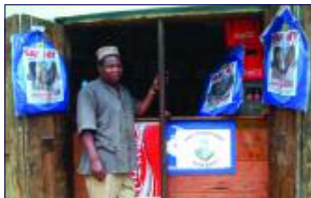
Duka la rejareja la kuuza vyandarua vyenye dawa Lushoto

Upatikanaji wa Vyandarua Vyenye Dawa umeongezeka sehemu nyingi ambapo kuna angalau kliniki moja ya afya ya mama na mtoto inayotoa Hati Punguzo kwa wajawazito na watoto katika kila kata, na hii imehamasisha kuwepo kwa angalau duka moja katika kata linalouza Vyandarua Vyenye Dawa na kupokea Hati Punguzo.