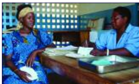
Mama mjamzito akipokea Hati Punguzo wakati anapotembelea kliniki ya afya ya mama na mtoto

Ili kuyafikia makundi yaliyoko hatarini zaidi, mipango miwili ya Hati Punguzo ilianzishwa mwaka 2004 na 2006, hizi ni Hati Punguzo ya Wajawazito na Hati Punguzo ya Watoto. Hadi kufikia Septemba 2009, Hati Punguzo za Wajawazito zipatazo 3,754,538 na Hati Punguzo za Watoto 1,193,684 zilitumika kununua Vyandarua Vyenye Dawa.