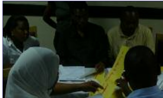
Baadhi ya waandishi wa habari na wahariri wakijadiliana kwenye makundi wakati wa mafunzo juu ya Malaria