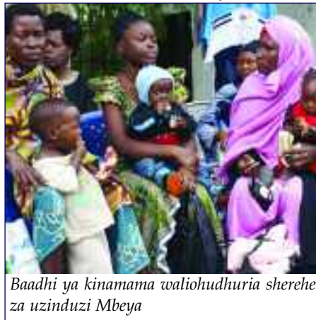
Baadhi ya kinamama waliohudhuria sherehe za uzinduzi Mbeya

matumizi ya vyandarua vyenye dawa yanapunguza vifo vya watoto wachanga kwa asilimia 30 na ugonjwa wa upungufu wa damu kwa wajawazito kwa asilimia 60. Hivyo, kampeni hii inategemea kupunguza kwa kiasi kikubwa vifo vinavyohusiana na ugonjwa wa malaria kwa watoto na makundi mengine yaliyo hatarini.