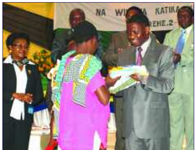
Waziri wa Afya na Ustawi wa Jamii, Prof. David Mwakyusa akitoa chandarua chenye dawa ya kudumu kwa muda mrefu kwa mama mwenye mtoto wa chini ya miaka mitano wakati wa uzinduzi wa kampeni mkoani Mbeya.