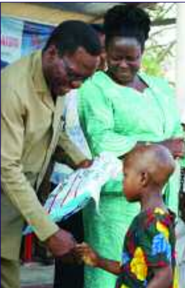
Waziri Mkuu, Mhe. Mizengo Pinda akitoa chandarua wakati wa kampeni ya majaribio wilayani Mpanda

Kampeni hii ilifanyiwa majaribio Septemba 2008 Wilayani Mpanda, uzinduzi wa kampeni ya majaribio ulifanyiwa na Waziri Mkuu, Mh. Mizengo Pinda. Hivi sasa kampeni hii inaendelea kutekelezwa nchi nzima. Kampeni hii itafuatiwa na Mikakati wa Keep-up unaolenga kutatua changamoto ya bei ya vyandarua vyenye dawa kwa kuwawezesha wajawazito na watoto kupata vyandarua vyenye dawa kwa bei ya SH 500/- tu kwa kutumia Hati Punguzo ya Wajawazito na Hati Punguzo ya Watoto.