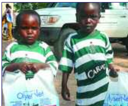
Watoto wilayani Mpanda wakitoka kupokea vyandarua vyenye dawa wakati wa kampeni ya majaribio

Kabla ya kampeni tulikuwa na mwezi mmoja wa maandalizi, ambapo Halmashauri ya Wilaya ya kwa kushirikiana na Mpango wa Taifa wa Kudhibiti Malari na wadau tuliunda mpango kazi uliobainisha majukumu ya wahusika na kuelekeza utekelezaji. Vilevile ufuatiliaji wa mara kwa mara ulifanyika ili kuhakikisha kuwa watekelezaji wakuu wanatambua majukumu yao na changamoto zilizojitokeza zilitatuliwa katika ngazi ya Wilaya na Kitaifa. Mafunzo ya usajili, utiaji dawa, na ugawaji wa vyandarua na jinsi ya kutoa ripoti yalitolewa kwa